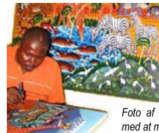
Foto af Tingatinga i færd med at male.

I yngste klasse 5 har vi arbejdet med afrikansk kunst. Vi har hørt om kunstmaleren Edward Saidi Tingatinga, der malede sine billeder med cykellak på masonitplader. Eleverne har selv produceret deres egne flotte Tingatinga billeder med motiv fra den afrikanske Savanna.