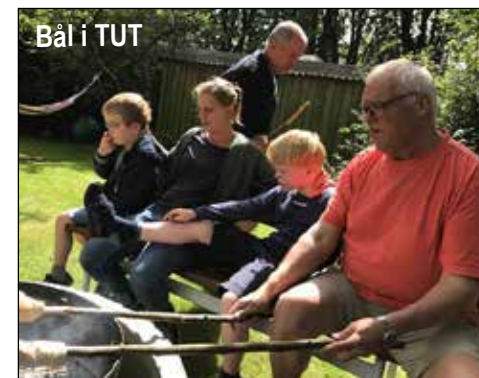
Bål i TUT