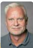
De varmeste hilsener fra