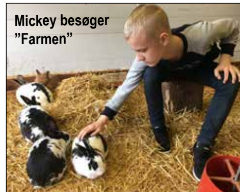
Mickey besøger "Farmen"