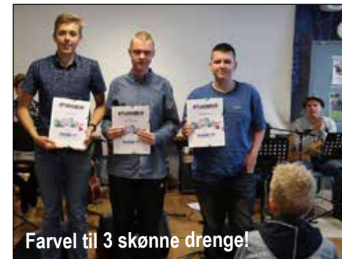
Farvel til 3 skønne drenge!