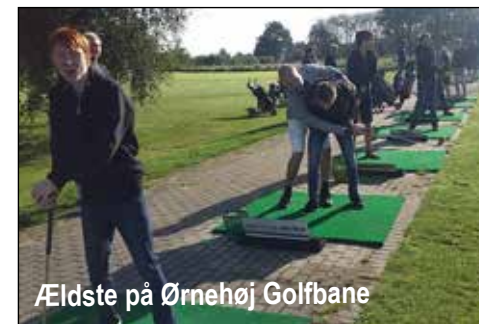
Ældste på Ørnehøj Golfbane