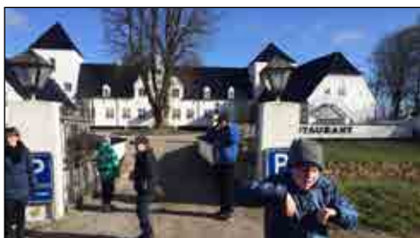
Her er vi ved Gl. Vrå Slot

På side 11 kan I læse om vores besøg ved "Flyverstenen" i Nørlund, hvor der i 1945 faldt en engelsk flyvemaskine ned. Venlig hilsen TUT.