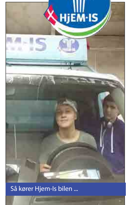
Så kører Hjem-Is bilen ...

Grunden til at der var gratis is, var at de skulle af med deres 2. sorterings varer, men vi syntes nu allesammen det var 1. klasses is!