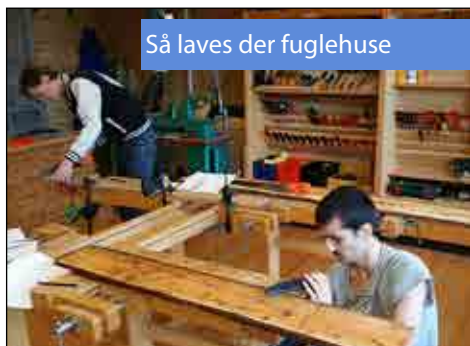
Så laves der fuglehuse