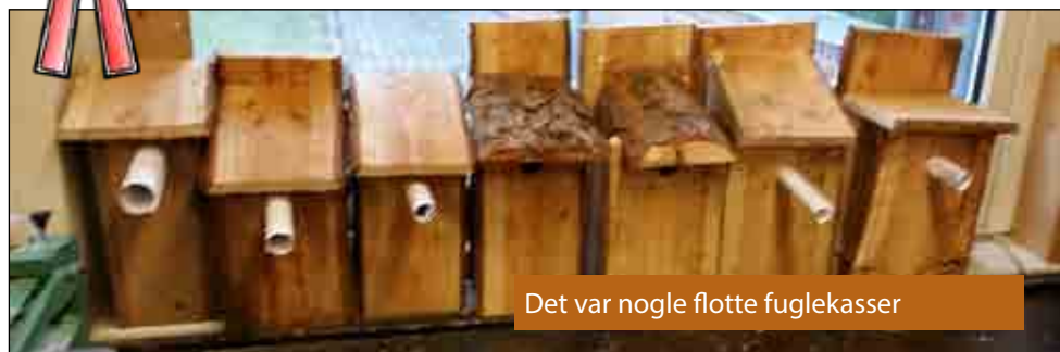
Det var nogle flotte fuglekasser

Christina fra ældste team var så heldig at vinde 1. præmien i gæt en fugl og vandt en flot fuglekasse!