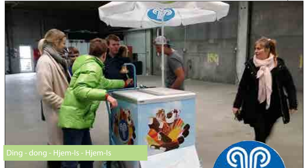
Ding - dong - Hjem-Is - Hjem-Is