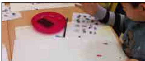
Vi så hvordan eleverne arbejdede