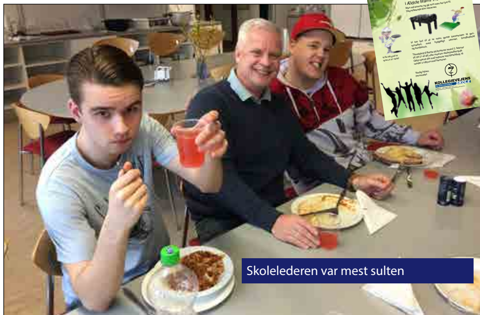
Skolelederen var mest sulten

Der blev serveret Chili Con Carne og alle havde en dejlig aften med rigtig god snak og hygge. En god tradition der helt sikkert vil blive gentaget næste år!