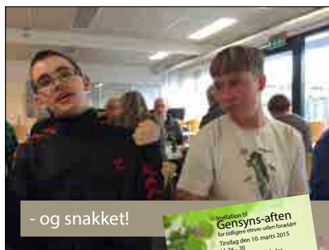
- og snakket!