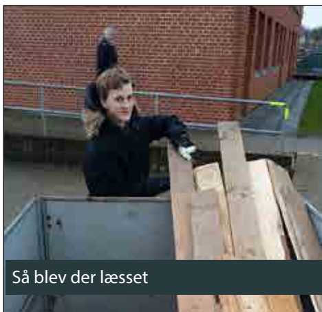
Så blev der læsset