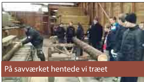
På savværket hentede vi træet

Forløbet indledtes med et besøg på et savværk, hvor vi fik lov til at skære vores egne brædder, og efterfølgende gik vi i gang med at vælge fuglekassestørrelser og foderbrædder. Forløbet tog ca. en måned, og vi afsluttede med en udstilling af produkterne. Som en lille ekstra gimmick, lavede vi en "gæt-en-fugl"-konkurrence, hvor vinderen modtog en custom-bygget fuglekasse.