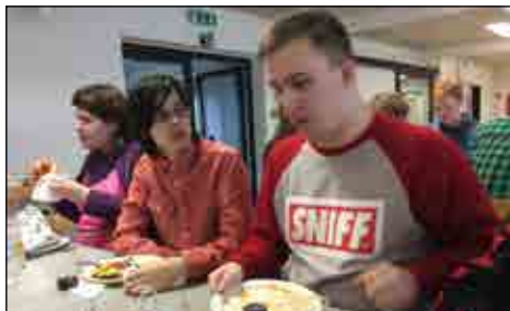
Der blev rigtig snakket ...