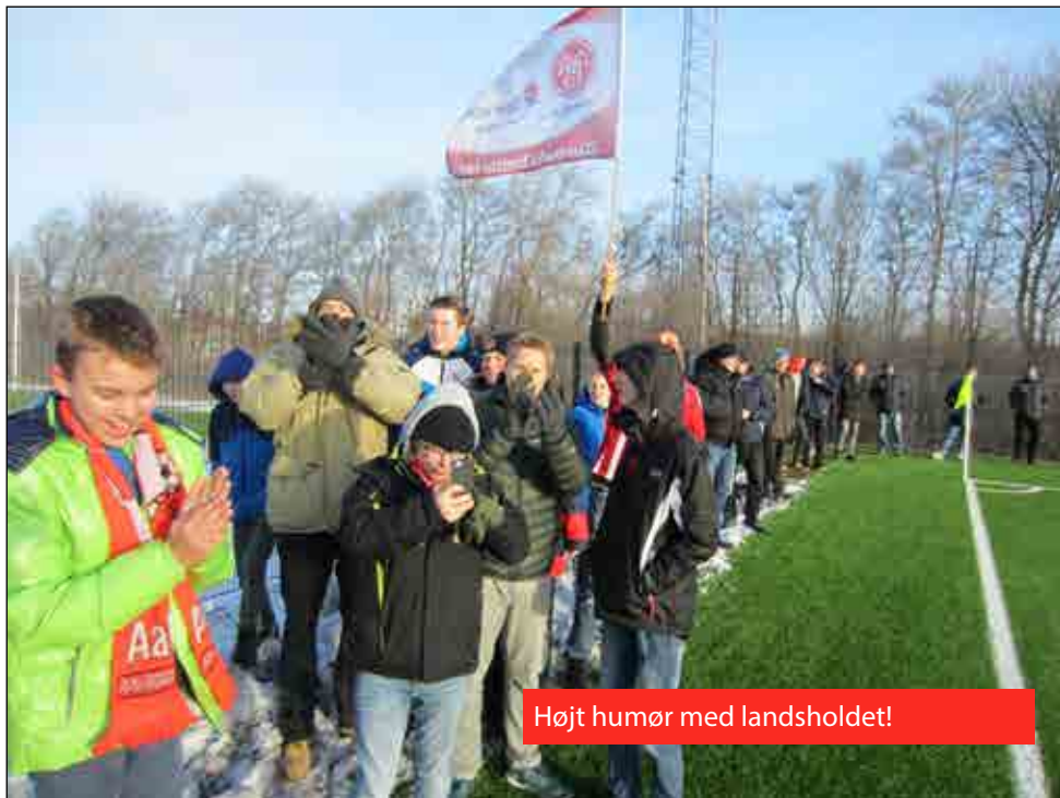
Højt humør med landsholdet!