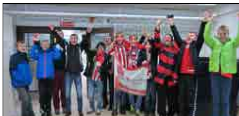
Landsholdet - yeeeeeeeeeh!