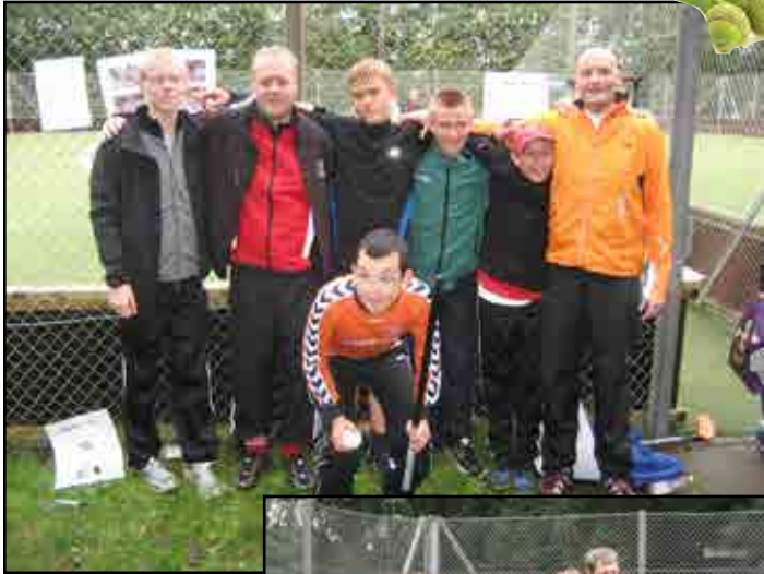
Det stolte vindende hold!