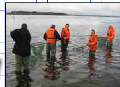
Team4 på Egholm