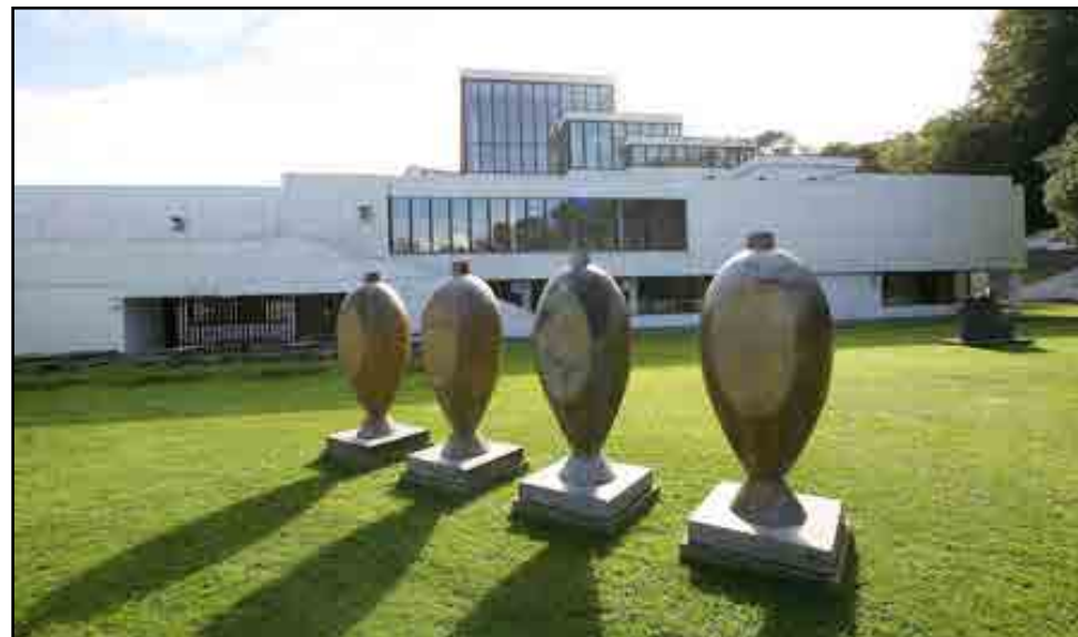
Kunsten i Aalborg - et besøg værd!