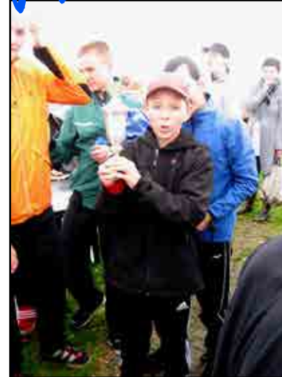
Det var en fantastisk dag hos Agernhuset - især fordi vi vandt pokalen.