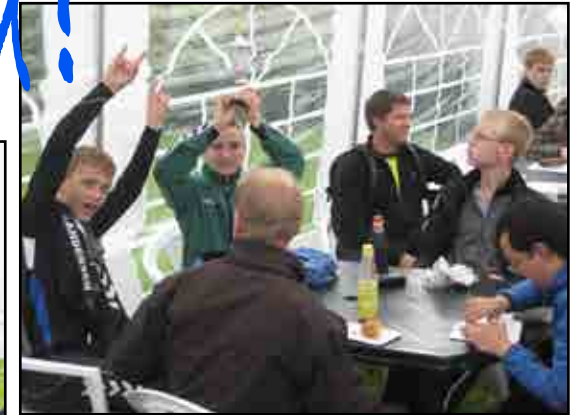
Pokalen blev løftet rigtig højt!