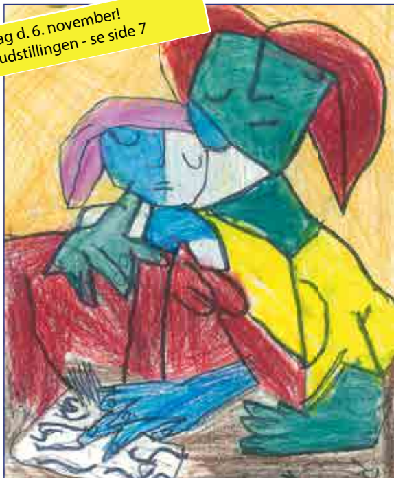
Anders 3. kl.

Sidste chance søndag d. 6. november! Team 4 har besøgt udstillingen - se side 7