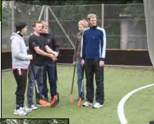
Her bliver der lagt taktik inden kampen.