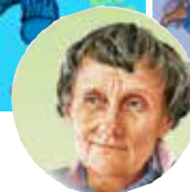
Astrid Lindgrens Verden