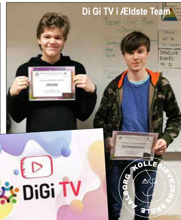
Di Gi TV i Ældste Team