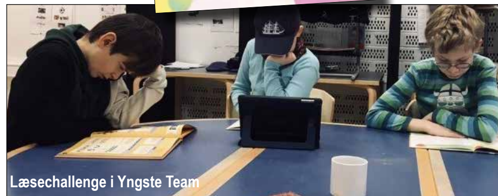
Læsechallenge i Yngste Team