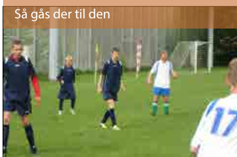
Så gås der til den