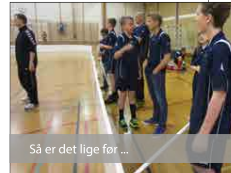
Så er det lige før ...