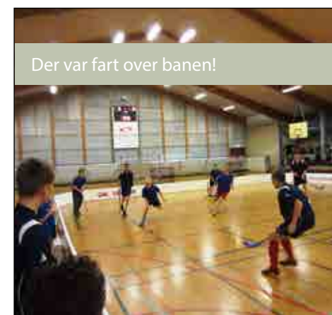
Der var fart over banen!