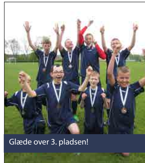
Glæde over 3. pladsen!