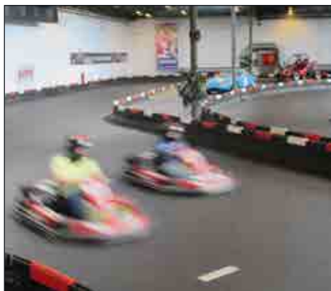
Wruuummm - der var fart på!