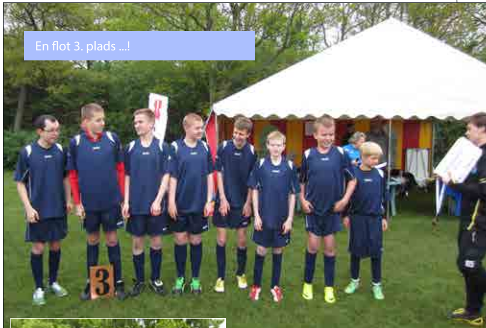
En flot 3. plads ...!