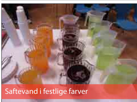
Saftevand i festlige farver