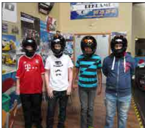
Fire flotte racerkørere