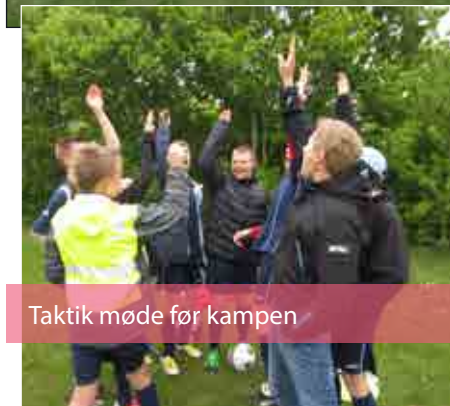
Taktik møde før kampen