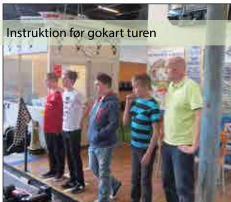
Instruktion før gokart turen