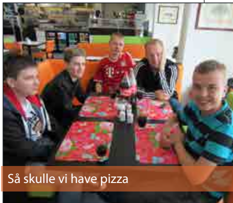
Så skulle vi have pizza