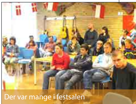
Der var mange i festsalen