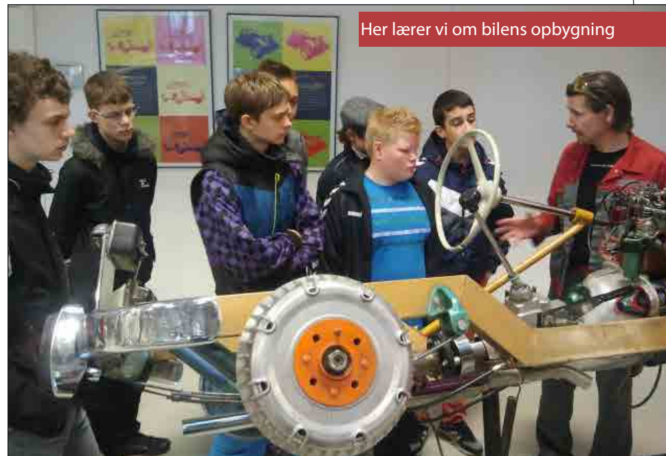
Her lærer vi om bilens opbygning

Ældste team har været på Auto College Aalborg, hvor eleverne lærte lidt om biler. De lærte om vedligeholdelse, rengøring og bilreparationer.