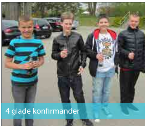
4 glade konfirmander

Onsdag d. 30. april blev der holdt blå mandag, som vi så kalder rød onsdag!