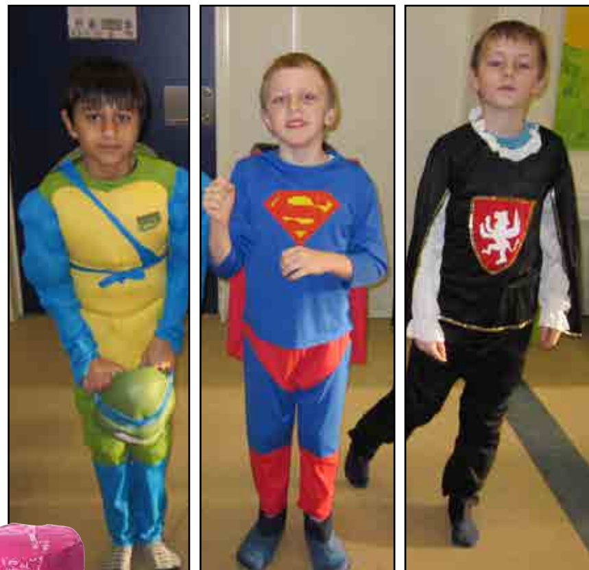
Tre seje gutter fra fastelavn 2011

NINJA TURTLE SUPERMAN RIDDER MOZAMEL EMILI JONAS