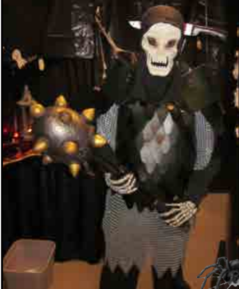
Jonas som dødens kriger!