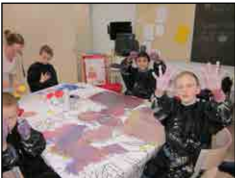
Se, vi kan fingermale!