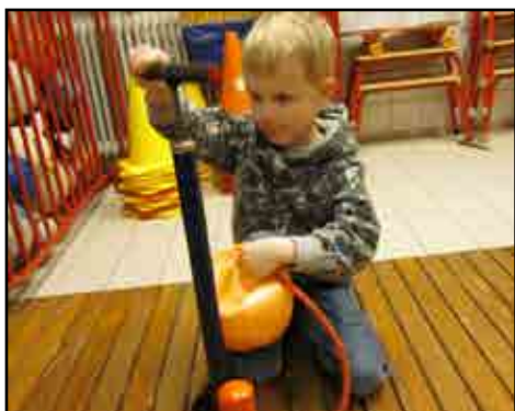
Luft skal der til ...!