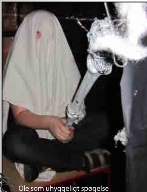
Ole som uhyggeligt spøgelse