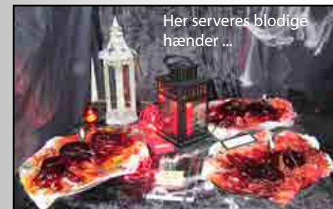
Her serveres blodige hænder ...