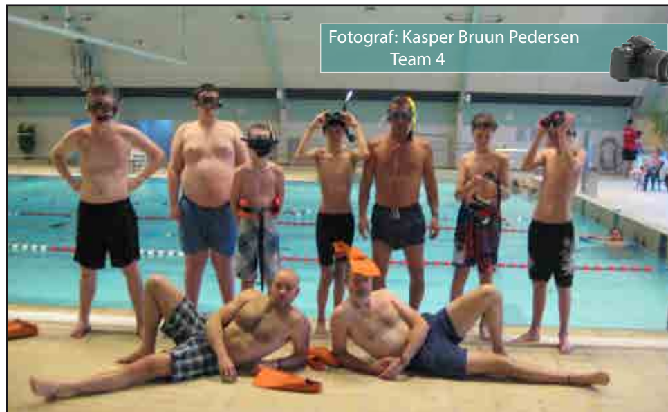
Fotograf: Kasper Bruun Pedersen Team 4