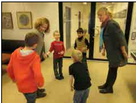
Vi snakker om kroppen ...