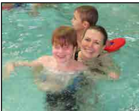
Det er skønt med vand!