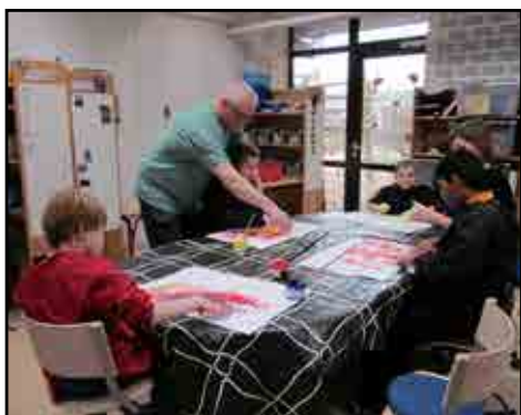
Uhhmm - fingermaling ...